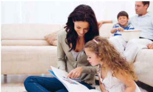
Die Versorgung mit Erdgas bleibt während der Umstellung gesichert.

Weil das Erdgas L langsam zur Neige geht, wird das Erdgasnetz nach und nach auf das Erdgas H umgestellt – so auch 2023 in Halver. Um diese sogenannte Marktraumumstellung Gas kümmert sich Westnetz als Gasnetzbetreiber in der Region. Die Grundlage bildet der Netzentwicklungsplan für das deutsche Gasnetz, den die Gasnetzbetreiber in Abstimmung mit der Bundesnetzagentur entwickelt haben.