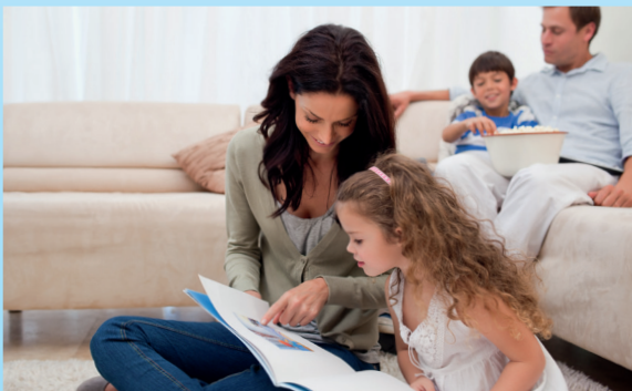
Die Versorgung mit Erdgas bleibt während der Umstellung gesichert.

Weil das Erdgas L langsam zur Neige geht, wird das Erdgasnetz nach und nach auf das Erdgas H umgestellt – so auch 2017 in Hilter a. T. W. Um diese sogenannte Marktraumumstellung Gas kümmert sich Westnetz als Gasnetzbetreiber in der Region. Die Grundlage bildet der Netzentwicklungsplan für das deutsche Gasnetz, den die Gasnetzbetreiber in Abstimmung mit der Bundesnetzagentur entwickelt haben.