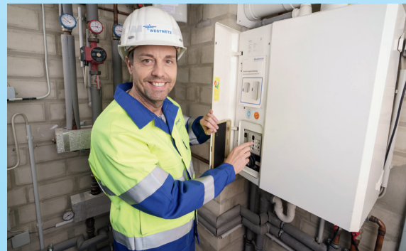
Westnetz wird unter anderem die Gastherme anpassen.

Diese Umrüstung, die sowohl alle Privathaushalte als auch Unternehmen betrifft, übernehmen wir für Sie – und zwar in aller Regel kostenlos. Lediglich bei einigen wenigen Gasgeräten, die nicht mehr anpassbar sind, können gegebenenfalls Kosten auf Sie zukommen. Für eine Heizungs- oder Gebäudemodernisierung haben Sie auch die Möglichkeit, öffentliche Fördermittel in Anspruch zu nehmen.